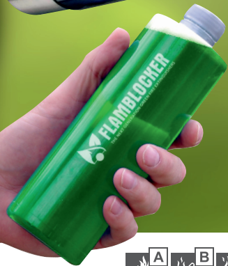
Flamblocker® Throwing Grenade